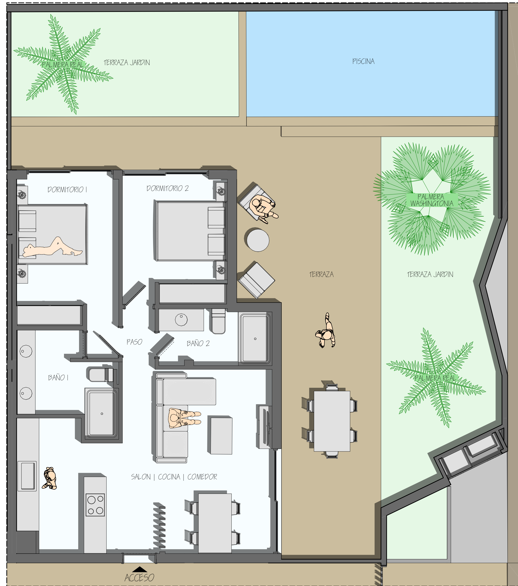
A. Corner Garden Residence